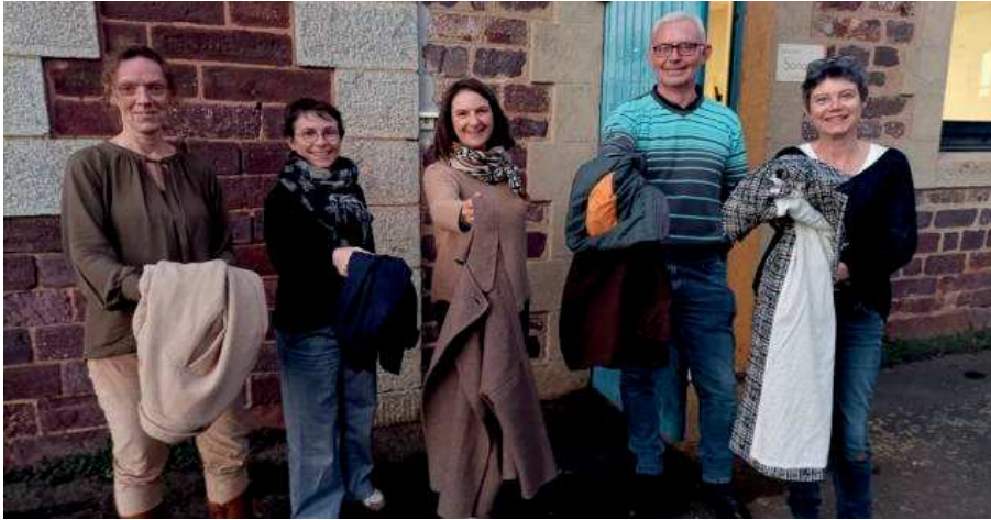
Les membres de Cêhapi donnent rendez-vous pour un troc d'automne. Une initiative pour faire des économies et réfléchir à d'autres modes de consommation.

Samedi 19 novembre , salle des Disous. Le dépôt des vêtements et accessoires se fera de 10 h à 12 h, et le troc, de 14 h à 18 h. Inscription sur www.kehapi.org ou le jour même, salle des Disous (derrière l'hôtel de ville).