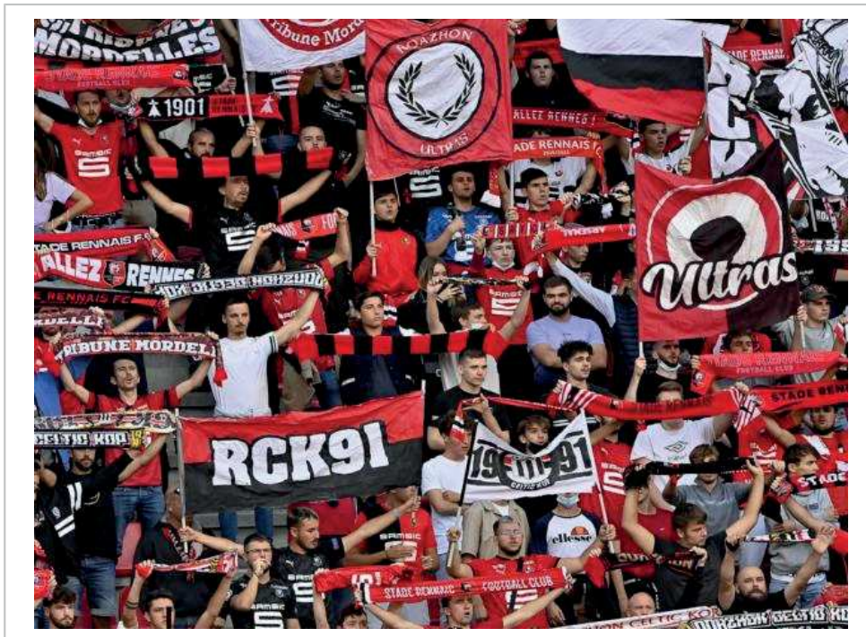
Le tribunal rendra sa décision le 21 décembre, dans le procès autour du vol de la bache du RCK.