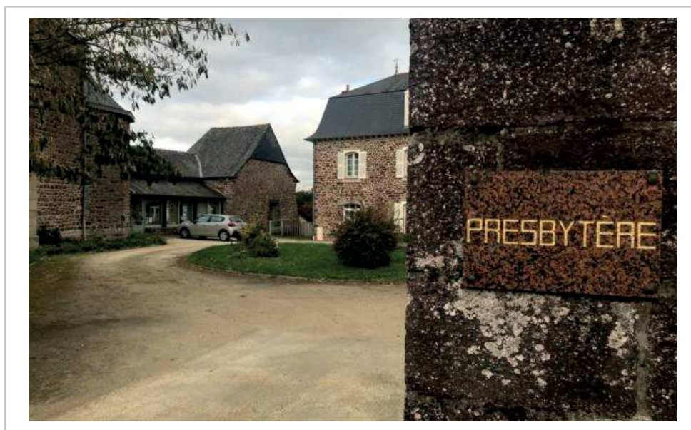
La commune Montfort-sur-Meu, à l'ouest de Rennes, est sous le choc.