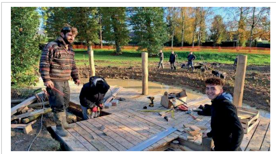
Les jeunes en formation à la MFR de Saint-Grégoire ont participé au projet de création de l'aménagement paysager autour de la mare des jardins du presbytère.