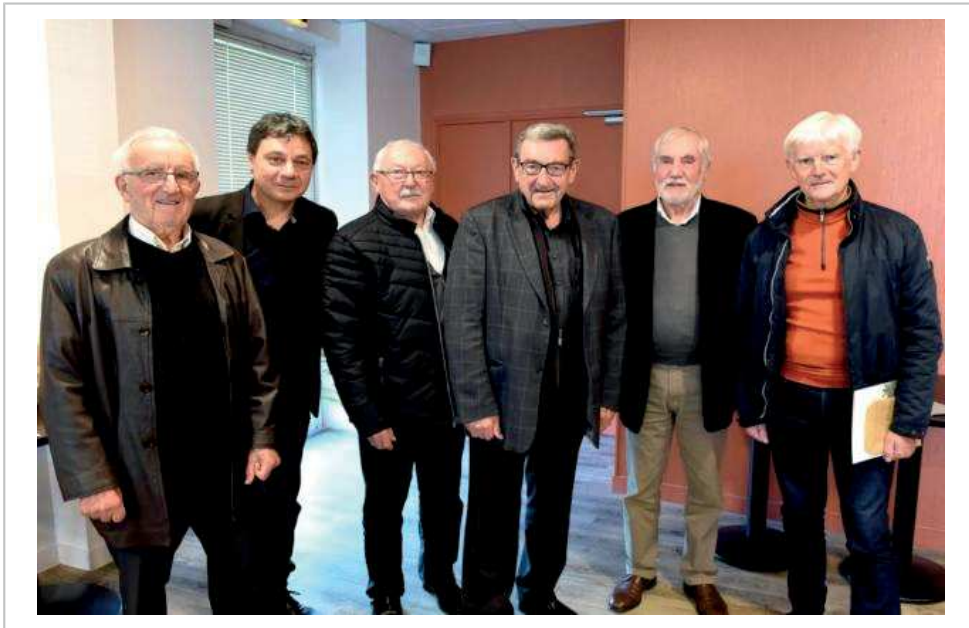
L'ancien maire et ses adjoints ont été mis à l'honneur

Avec ses élus, il a aussi travaillé sur les équipements existants, tout en conduisant de nouveaux projets qui permettent aujourd'hui d'accueillir un pôle santé dans la commune ; sans oublier la culture avec l'évolution de la bibliothèque au fil des années.