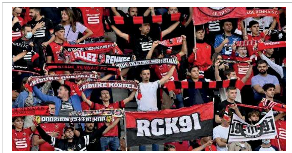
Quatre supporters ultras du PSG sont soupçonnés d'avoir agressé un supporter du Stade Rennais, membre du groupe ultra Roazhon Celtic Kop, pour lui voler la bâche « totem » du RCK.

À l'époque, le procureur de la République de Rennes avait précisé que l'enquête des gendarmes avait permis d'identifier ces hommes comme membres du groupe Karsud, des ultras du PSG qui ne se rendent plus au stade depuis la saison 2017-2018.