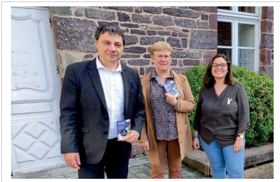
Élus et agents ont travaillé à une programmation destinée aux seniors.

Programme complet à retrouver sur : www.montfortcommunaute.bzh