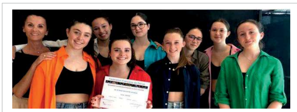
Le groupe concours de l'ACHVB financera ses déplacements grâce à la braderie.

Dimanche 27 novembre, de 8 h à 16 h 30, salle polyvalente.