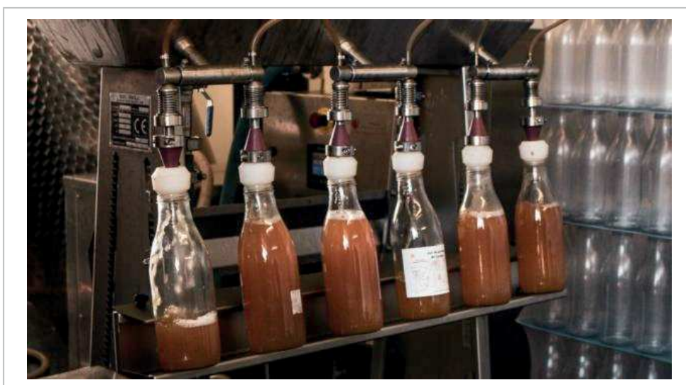
La Baraque à jus installée à la ferme à Marcus de Breteil participe à la Semaine du tourisme économique et des savoir-faire.

Inscription obligatoire sur le site semaine-tourisme-economique.bzh . Tarif : 2,50 € par visite, une partie des recettes sera reversée à la Société nationale des sauveteurs en mer (SNSM). Informations auprès de l'office de tourisme de Montfort Communauté au 02 99 09 06 50 ou tourisme@lacadetremelin.com