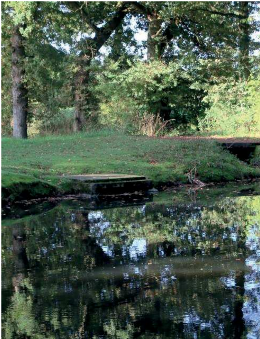
La femme retrouvée décédée dans un étang de Breteil a été identifiée.