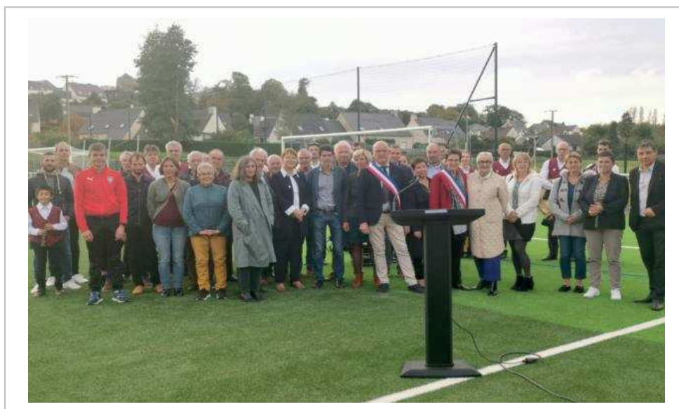
À la fin du match des U17 régional 2 La Vaunoise contre Pacé, samedi, les élus accompagnés du Bagad Men Ru de Montfort ont inauguré le terrain de football synthétique.

« Un tel investissement à Talensac permet aux différents clubs du territoire d'allonger leurs temps de jeux et de promouvoir la pratique du football. Car il est bien entendu que cet équipement aura un rayonnement communautaire. Il représente aussi un outil social d'égalité des chances. ».