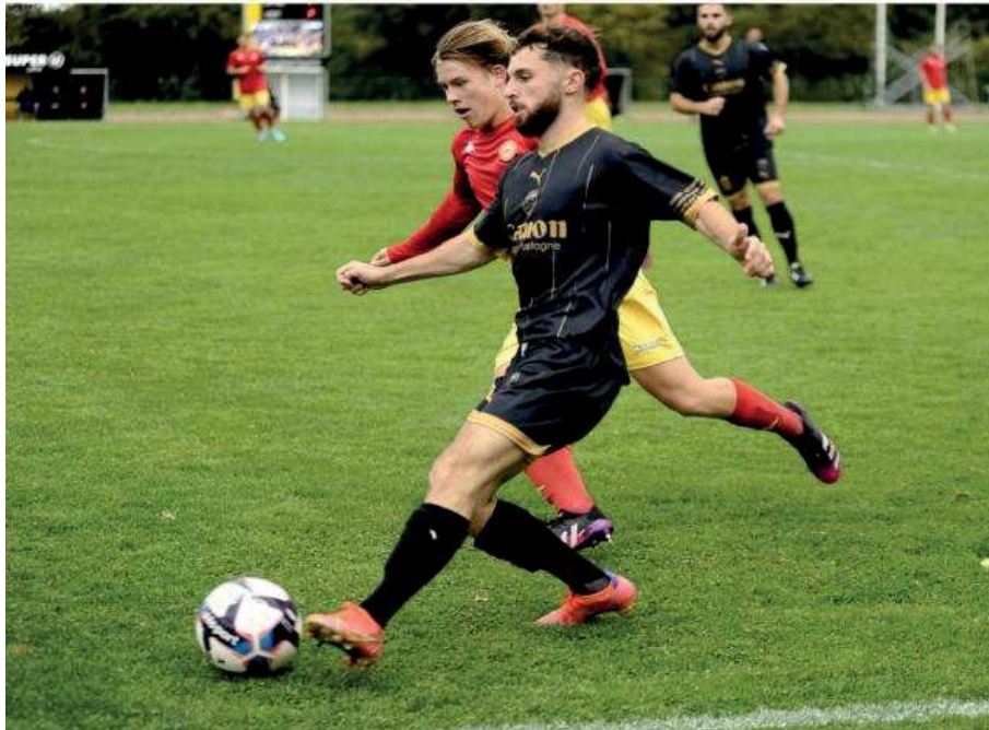
Potel et les Liffréens s'imposent face aux réservistes vitréens.

AVERTISSEMENTS. Liffré : Lemétayer (61'), Moulin (75'), Maurice (77').