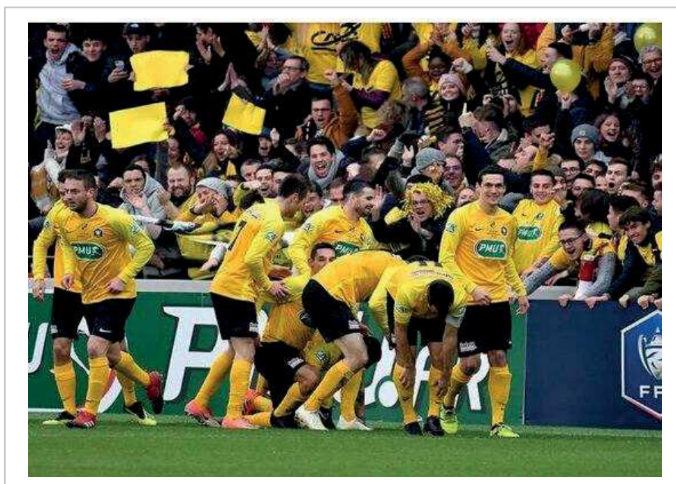
Le Stade Pontivyen avait ouvert le score, contre Guingamp, en 32 e de finale de la Coupe de France 2019.