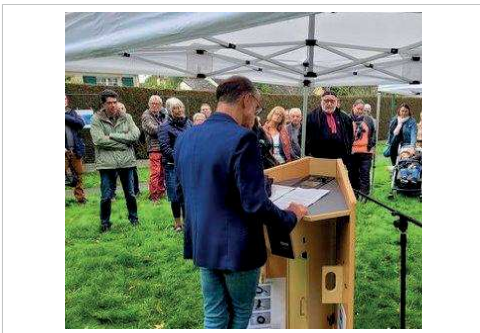
70 personnes étaient réunies au jardin du presbytère.