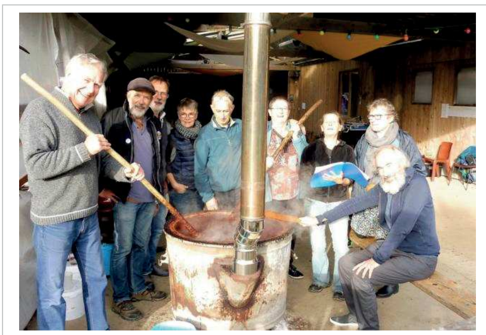
10 h du matin dimanche : La « ramaojerie » (action de mélanger lentement et continuellement) se poursuit jusqu'à 16 h, fin des 24 heures de cuisson

Une première fête du pomë réussie pour ce collectif de musiciens de la région qui avait déjà organisé les 10 et 16 avril, le Fest-Breizh Ukraine à Noyal et Servon, avec un chèque final de 2517 € remis à la Croix Rouge Ukraine.