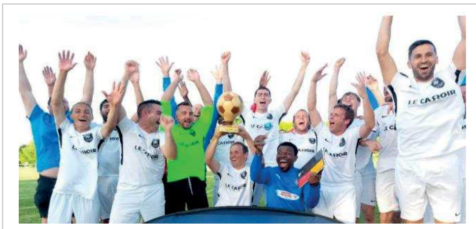
Les seniors A ont remporté la coupe Maxime-Portier pour la troisième fois en quatre ans.