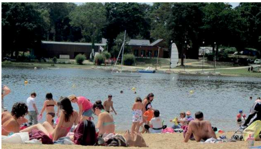
Au domaine de Trémelin, la baignade sera autorisée tout l'été.

Montfort communauté précise, par ailleurs, qu'il est interdit de fumer sur la plage et incite fortement les usagers à ramener leurs déchets avec eux.