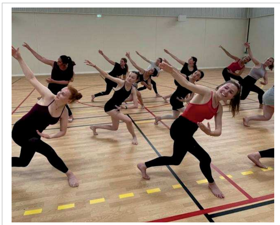
Heureuses de se produire samedi, les danseuses sont fin prêtes pour partager leur plaisir de la danse.

Contact : Valérie Recan bulle.dair.asso@gmail.com ; 06 37 26 92 30. Facebook : Bulle d'air Danse Modern'Jazz - Instagram : bulle_d_air_modern_jazz