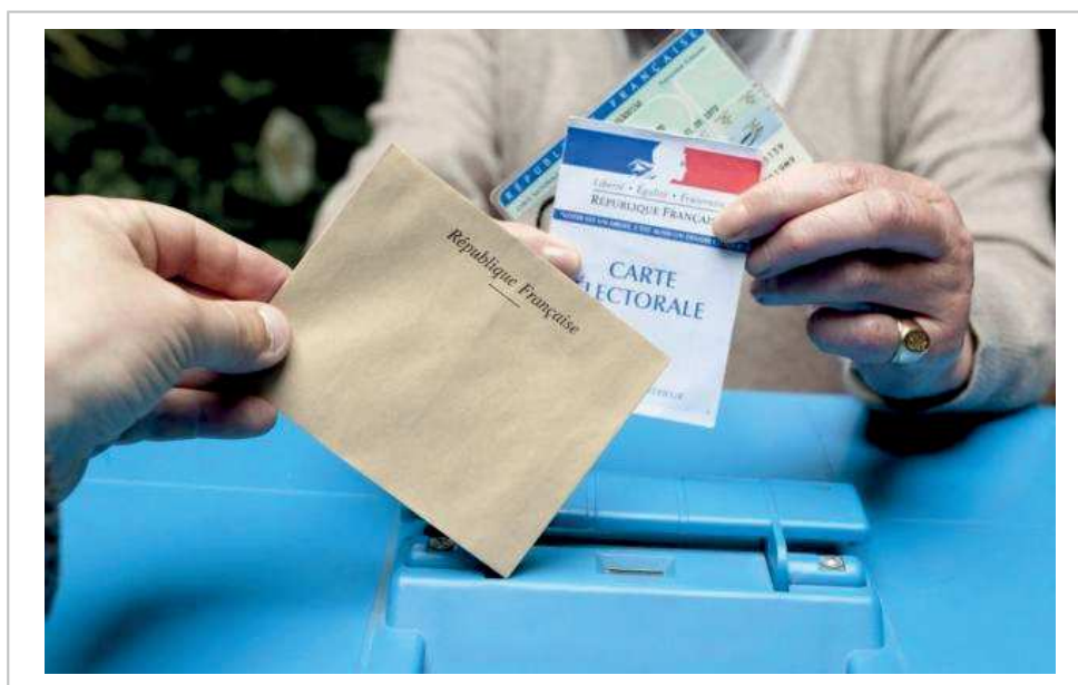
Les résultats sont tombés dans la troisième circonscription.

ouest-france.fr, dimanche 12 juin 2022, 322 mots