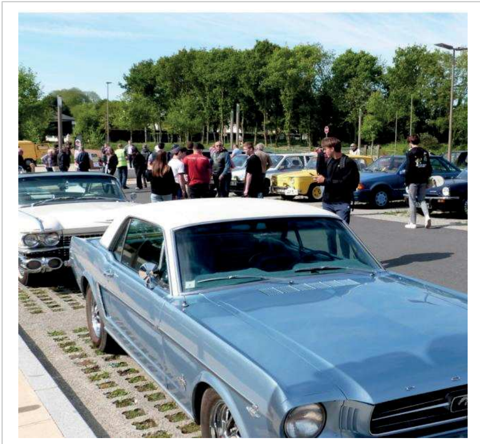
Les véhicules des adhérents de l'association seront exposés, dimanche.

Dimanche 5 juin, de 10 h à 13 h, parking du collège. Gratuit. Contact : Gérard Goron, tél. 06 60 13 81 20.