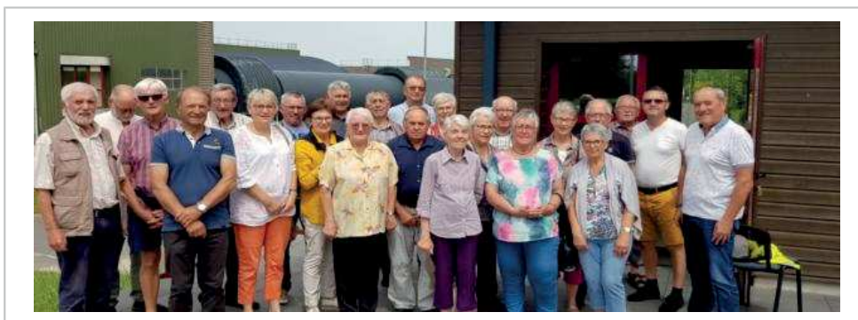
Une délégation de 22 membres de l'association des anciens élus a visité le site de collecte des ordures ménagères de Gaël jeudi 16 juin.