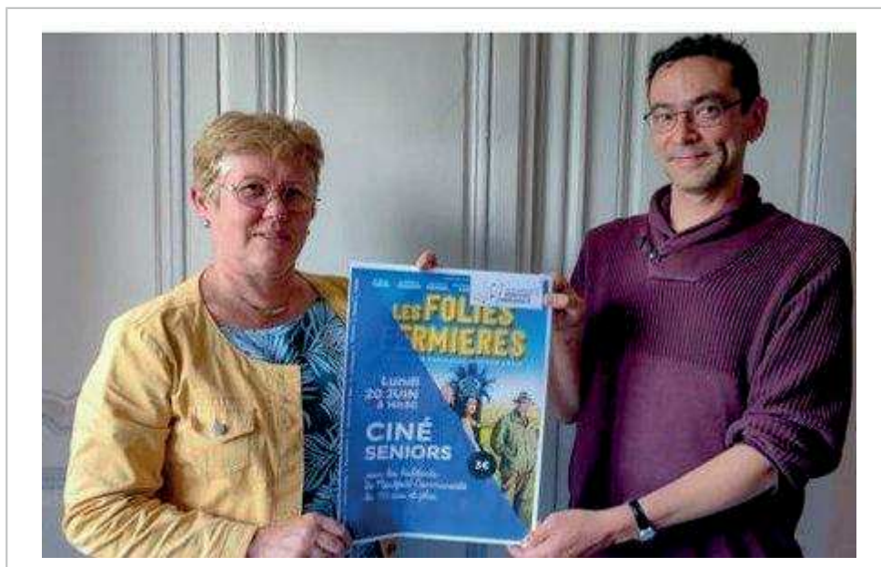
Élus et agents ont préparé ce nouveau rendez-vous pour les séniors. Le film retenu est « Les folies fermières », une comédie.

Le cinéma La Cane sera ouvert exclusivement aux personnes de plus de 70 ans et habitant Montfort communauté.