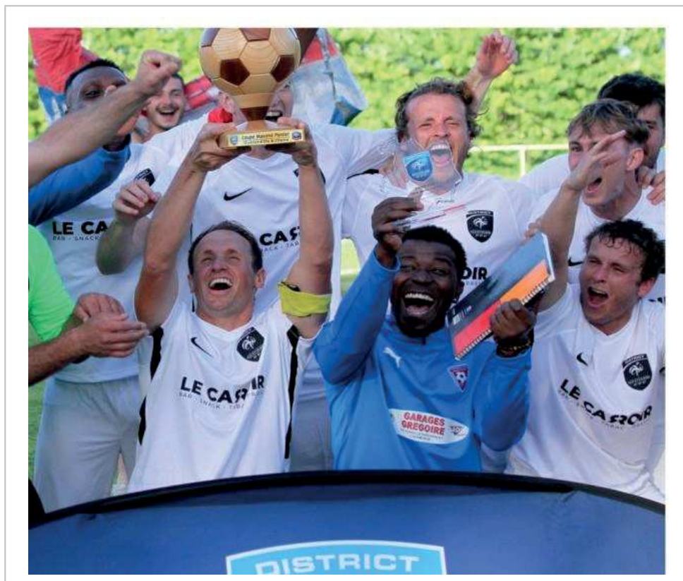
La joie des Breteillais.

EXPULSIONS. AC Rennes : Niasse (17'), Ahamada (90').