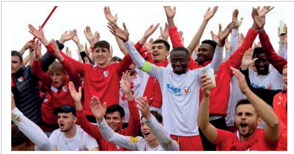
Surprise de la saison, Dol-de-Bretagne accède à la N3.

Ils rejoignent Liffré, l'AS Vitré B, Guichen, Redon, Saint-Malo B, Breteil-Talensac et Vignoc, qui ont tous renouvelé leur bail en R1.