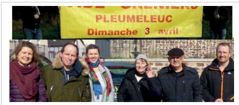
Les membres du comité sont mobilisés pour participer à l'organisation du vide-greniers.

À noter que le comité de jumelage a pris part aux collectes en faveur du peuple ukrainien. Des dons ont été transmis au comité de jumelage Breteil-Kwilcz et Montfort-sur-Meu-Pobiedziska, jumelés avec deux villes polonaises, un pays qui accueille un grand nombre de réfugiés ukrainiens.