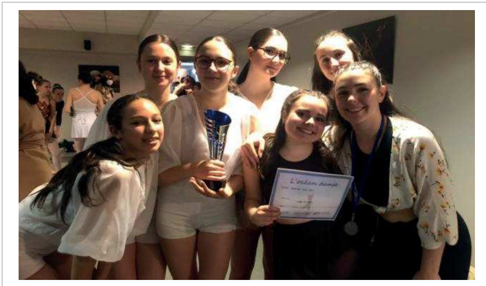
Les danseuses de l'ACHVB pourraient bien remporter à nouveau de nombreux concours.

Quant au groupe concours, il attend avec impatience les rencontres chorégraphiques de Pacé le 26 mars, au Ponant.