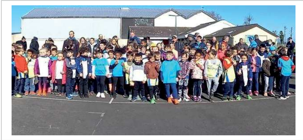
Samedi, l'école d'athlétisme Redek à Breteil a organisé une rencontre pour les enfants âgés de 6 à 9 ans.